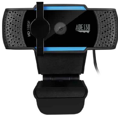
Модел: Cybertrack H5